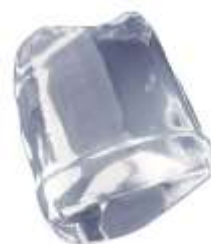
18 gr. FULL ICE CUBE